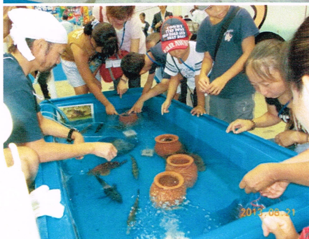
タッチプールで興味深く活魚に触る 親子。