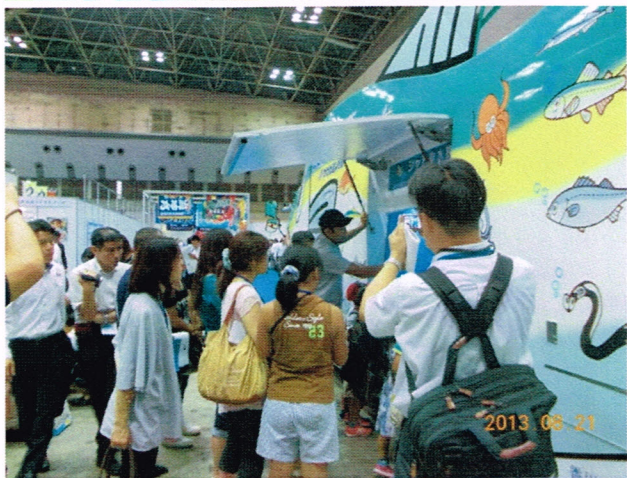
シャトルカーに近づく親子。