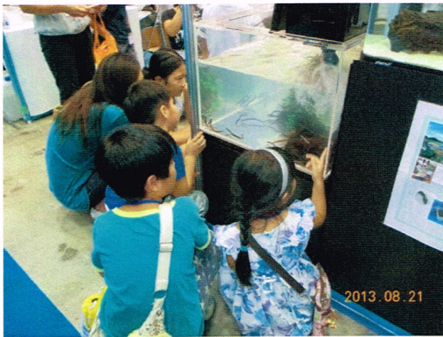
「これなにに?」「どじょう?」「いえ、ウナギの稚魚です」