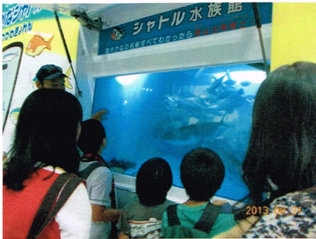
アジの群れとその下を泳ぐブリの様子を探る親子。