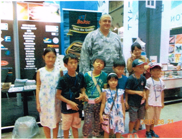
「やったぜ」 関脇把瑠都と記念撮影。