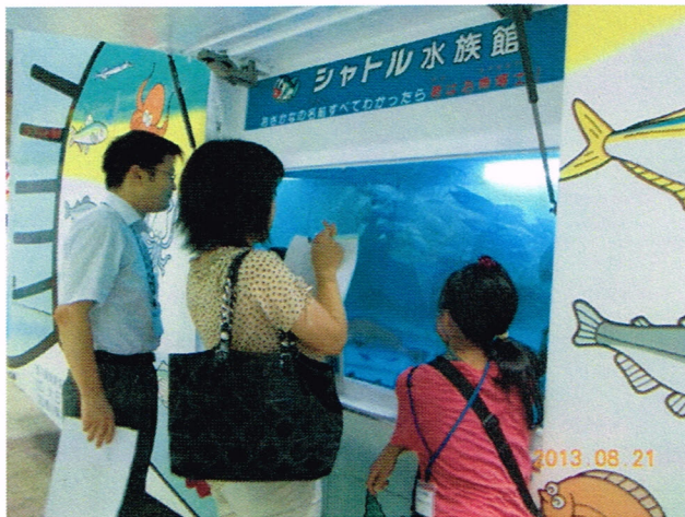
水槽の様子をメモするおかあさん。 子どもの夏休み課題宿題の参考？