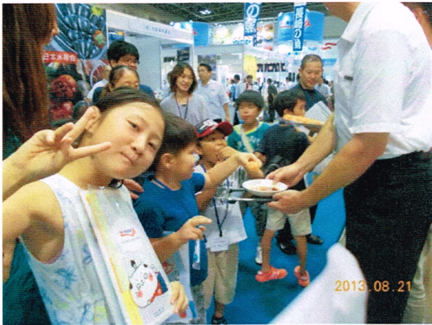
試食品を口に含み、「うまくやった」と笑みを見せる女の子。