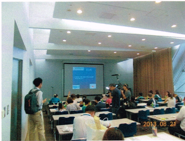
TV局が取材に来ました。