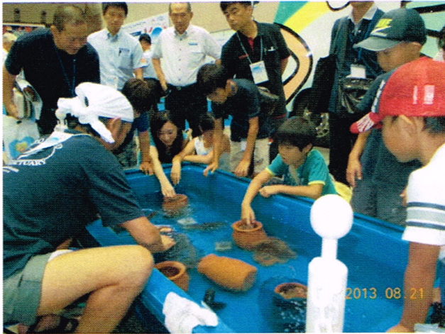
タコつぼ内のタコに触る親子。