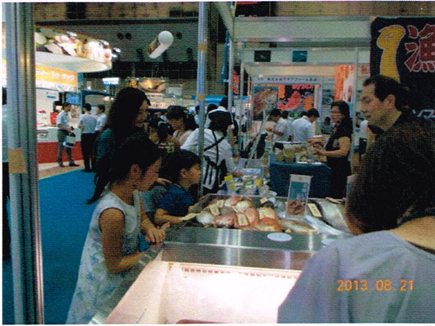
鮮魚出展者の展示物を眺める親子。