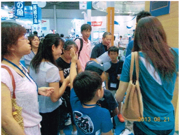
次の試食。口に頬張るおかあさんと「こちらにも」と手を上げるこども。