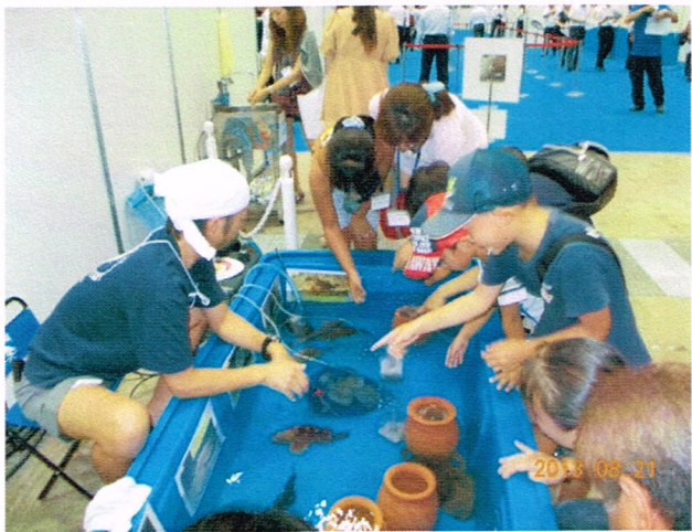
あれなーに、と指さす子ども。