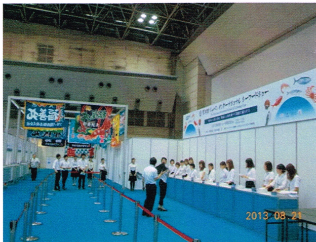
会場入口 受付テーブル