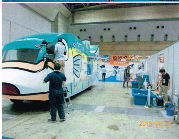
準備中のシャトルカー(移動水族館、 左) およびタッチプール(活魚プー ル、右)