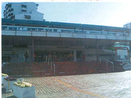
ポートタウン東駅