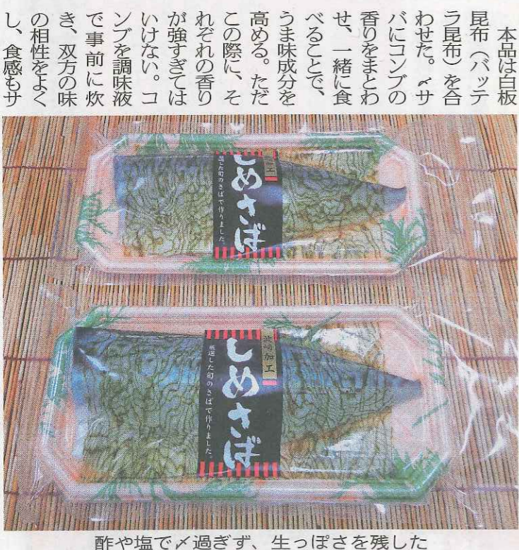
酢や塩で過ぎず、生っぽさを残した