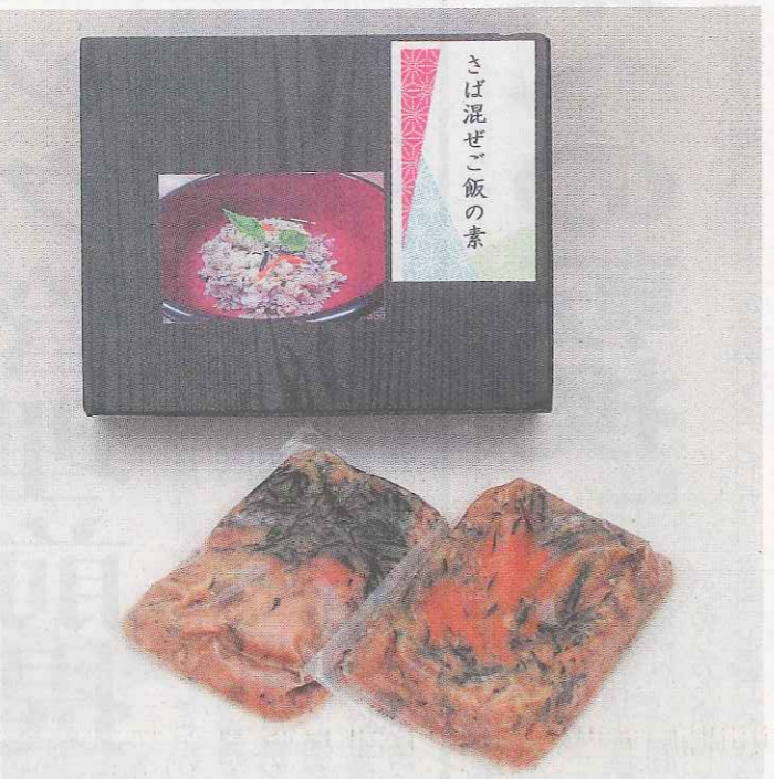
「さば混ぜご飯の素」のパック品①。おしゃれな小箱②に入れて販売される