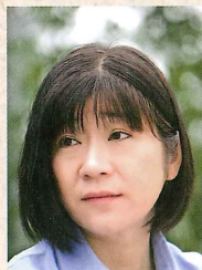
榎田みどり 農業ジャーナリスト