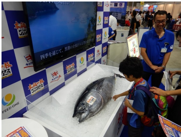
養殖クロマグロ（触りたくなるけど、触っちゃダメ！）