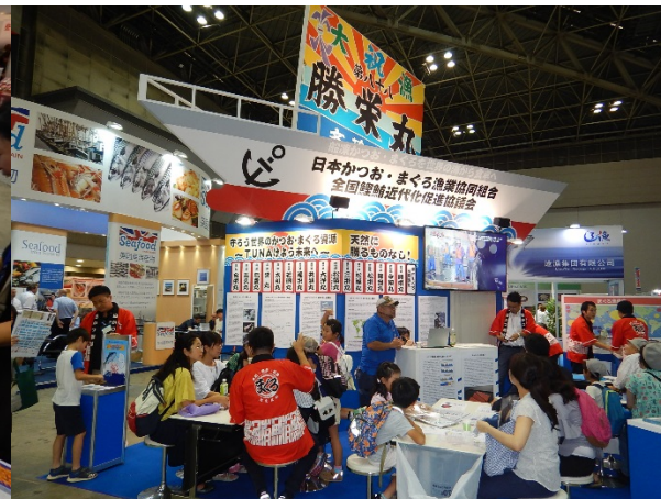
スタンプラリーと、天然マグロ試食！