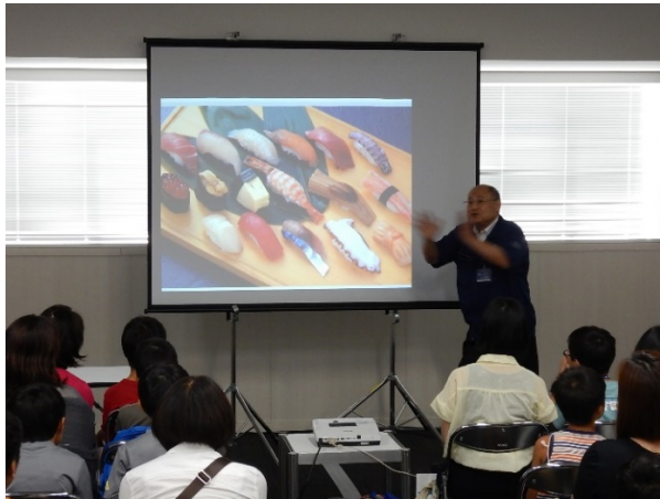
おさかなゼミで魚を楽しむコツを聞こう

「親子おさかな学習会」は魚好きの方は勿論、社会学習の場としても絶好の機会となります。