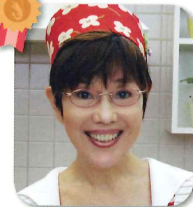
料理愛好家 平野レミ様