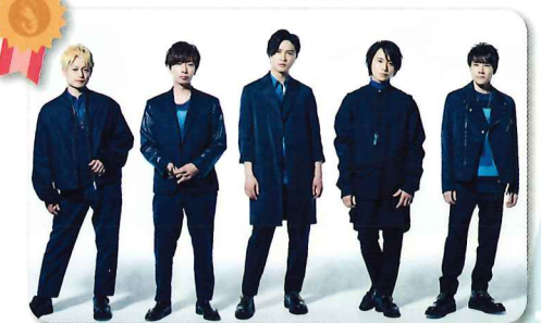
アイドルグループ A.B.C-Z様