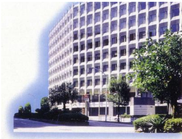
三会堂ビル (虎ノ門側より)