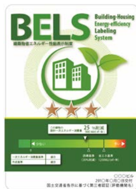
〔図1〕 ガイドラインに基づく第三者認証の例

また、デマンドリスポンスに対応した時間帯別・季節別の電気料金メニューが選択できる場合はその活用に努めるとともに、エネルギー管理システム（BEMS・HEMS等）の導入により、ビルの運用方法、住宅の住まい方の改善によるピーク対策及び省エネルギーに努めること。